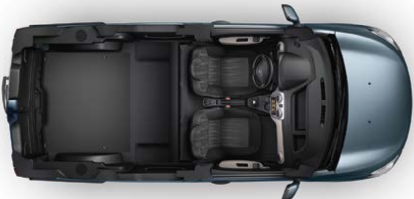
ספסל אחורי מקופל למצב אנכי