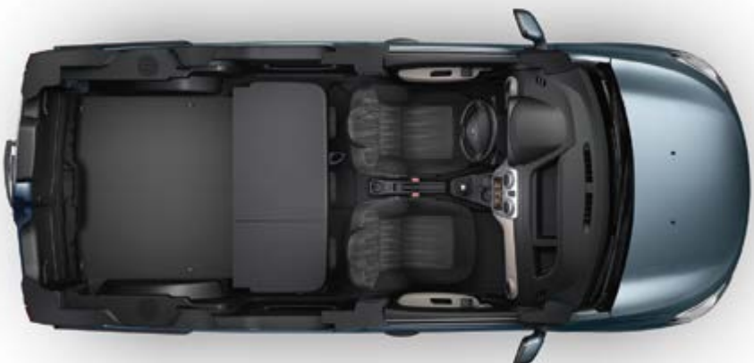
ספסל אחורי משוטח במלואו