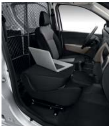
Easy Seat en tablette.

Pour accroître encore le chargement à bord, Dokker Van propose un siège passager multifonction inédit et ingénieux, le Dacia Easy Seat, entièrement extractible. Une fois retiré, il permet d'augmenter la longueur de chargement en la faisant passer de 1,9 m à 3,11 m, tandis que le volume utile évolue de 3,3 m 3 à 3,9 m 3 . Et avec le dossier replié, il peut astucieusement servir de bureau itinérant. Décidément, vous pouvez tout lui demander!