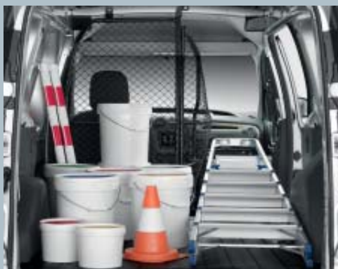
Cloison grillagée pivotante avec Easy Seat.