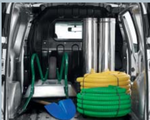
Cloison complète vitrée.

La capacité de chargement est déterminante pour vous? Dacia l'a compris et voit grand avec Dokker Van. Une charge utile de 750 kg*, un volume utile de 3,3 m 3 , une hauteur de chargement allant jusqu'à 1,27 m... Dokker Van a parfaitement intégré vos attentes professionnelles. Sa zone de chargement est équipée de 8 anneaux d'arrimage au plancher afin de vous permettre de fixer parfaitement les objets les plus fragiles. Et pour une zone de chargement impeccable dans la durée, Dokker Van est aussi disponible avec un tapis de coffre robuste et valorisant. Dacia Dokker Van sait aussi s'adapter à vos besoins. Trois types de cloisons vous sont proposés: tubulaire, complète vitrée ou grillagée pivotante (associée au Dacia Easy Seat). Ses portes latérales et arrière peuvent être soit tôlées, soit vitrées. Voilà de quoi faciliter votre travail au quotidien!