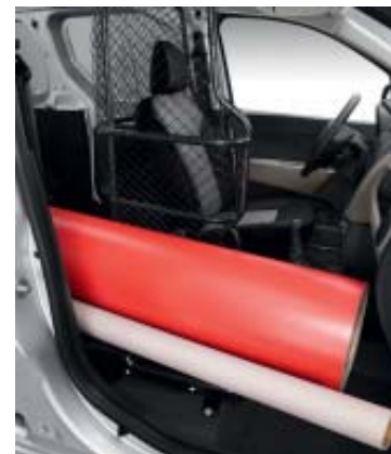
Easy Seat extrait.