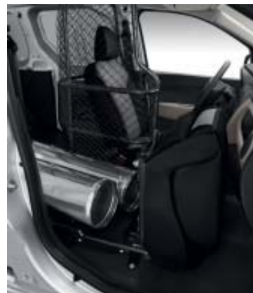
Easy Seat replié.