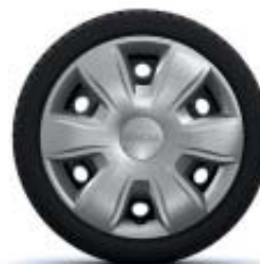
ENJOLIVEUR 15" TISA*