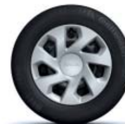
ENJOLIVEUR 15" GROOMY*