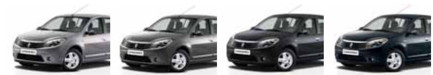
رمادي بلاتيني (D69) PLATINUM GREY D69