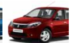
أحمر ناري (B76) FIRE RED B76

١. مصابيح الضباب تحسّن مستوى الرؤية في الأجواء الضبابية أو المطر.