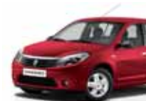
أحمر حار (21D(GO)) PASSION RED 21D(GO)