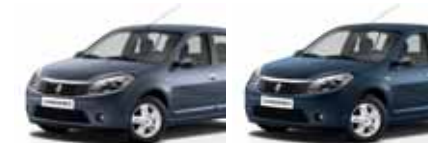
أزرق كهربائي (RNZ) ELECTRIC BLUE RNZ