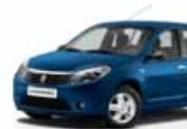
أزرق شديد (RNA) EXTREME BLUE RNA