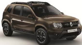
CNS - MARRÓN