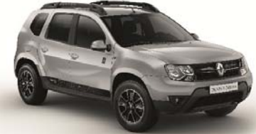
KNH - GRIS ESTRELLA