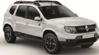
369 - BLANCO GLACIAR