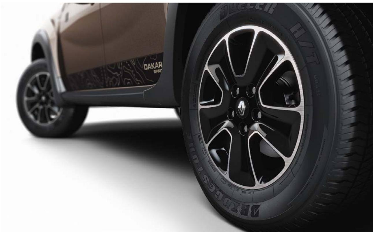
Llanta de aleación de 16 pulgadas negra diamantada. Sticker lateral "Dakar Spirit"