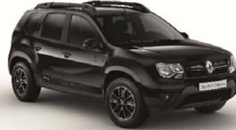
676 - NEGRO NACRÉ