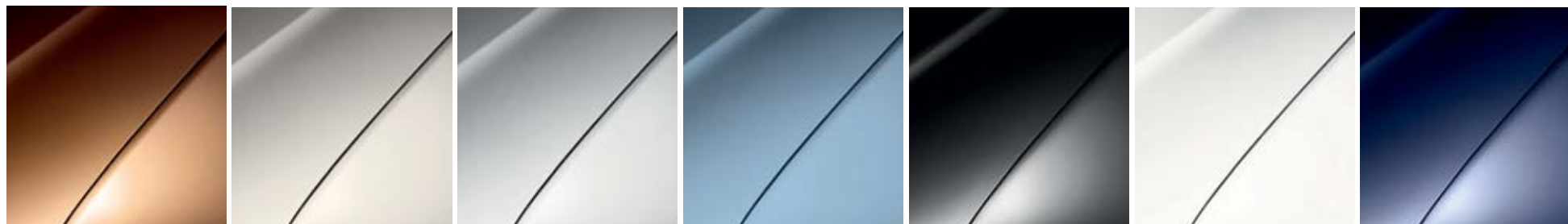
КАФЯВО (ТЕ SNA)*