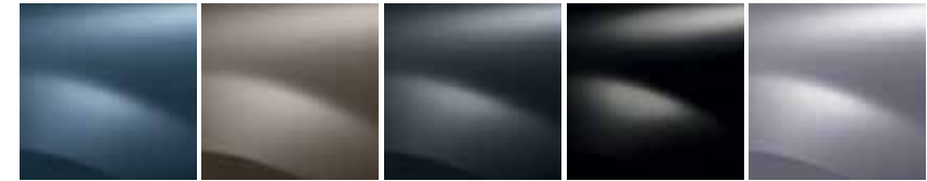
МИНЕРАЛНО СИН (RNF) БЕЖОВ (HNK) ТЪМНО СИВ (KNA) БИСЕРНО ЧЕРЕН (G76) СВЕТЛО СИВ (KHN)