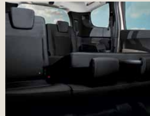
Седалка на втория ред, сгъваема 1/3 - 2/3*.