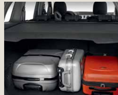
Ролетно покривало за багажник.