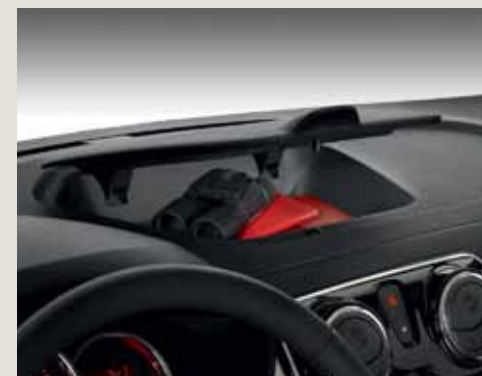
Отделение в горната част на арматурното табло