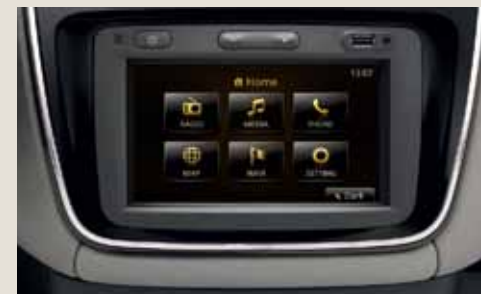
MEDIA NAV със 7 инчов тъч скрийн.

** Допълнителна информация за MEDIA NAV можете да откриете на www.dacia.bg .