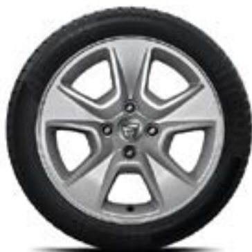
АЛУМИНИЕВИ ДЖАНТИ 15" NEPTA