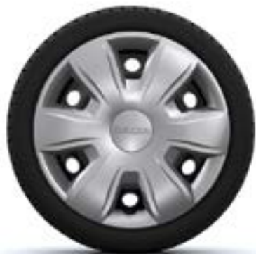
ТАСОВЕ 15" TISA*