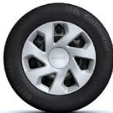
ТАСОВЕ 15" GROOMY*