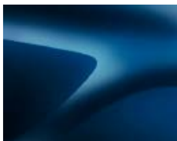
СИН „КОСМОС“ (RPR) (2)