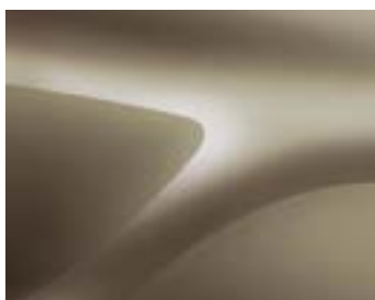
БЕЖОВ ДЮН (HNP) (2)