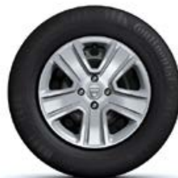
ТАСОВЕ 15" POPSTER*