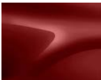
ЧЕРВЕН ФЮЖЪН (NPI) (2)