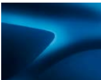
ЛАЗУРНО СИН (RPL) ** (2)