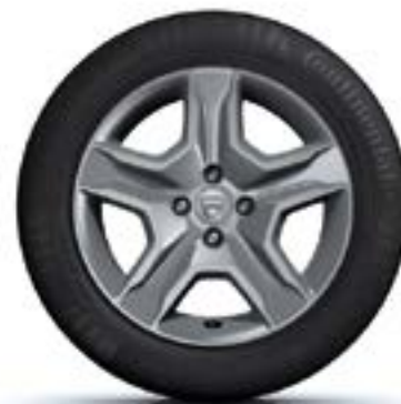
ТАСОВЕ 16" BAYADÈRE DARK METAL**

* Не се предлага със Stepway. ** Предлага се само със Stepway.