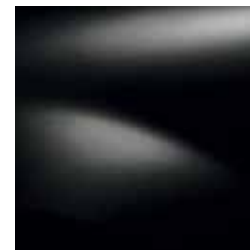
БИСЕРНО ЧЕРНО 676*