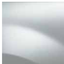
ЛЕДНИКОВО БЯЛО 369