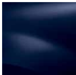
МОРСКО СИНЬО D42