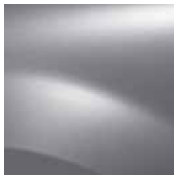
ПЛАТИНЕНО СИВО D69*