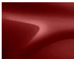
ЧЕРВЕН ФЮЖЪН (ТЕНPI) (2)