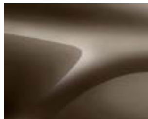
КАФЯВ „ВИЖЪН“ (СNM) (2)