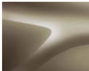
БЕЖОВ ДЮН (ТЕННP) (2)