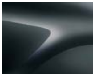
ТЪМНОСИВ (КНА) (2)