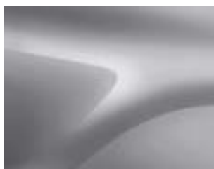
СИВ ХАЙЛЕНД (ТЕКQA) (2)