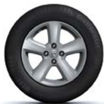
АЛУМИНИЕВИ ДЖАНТИ 15" CHAMADE*