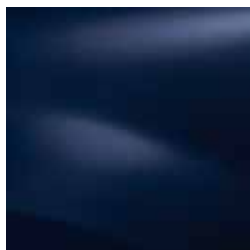
МОРСКО СИНЬО D42