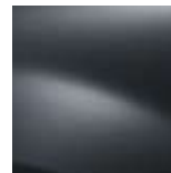
ТЪМНО СИВО KNA