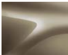
БЕЖОВ ДЮН (HNP) (2)