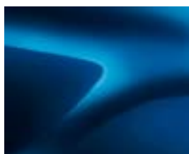
ЛАЗУРНО СИН (RPL) ***(2)