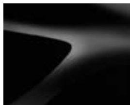
БИСЕРНО ЧЕРЕН (676) (2)