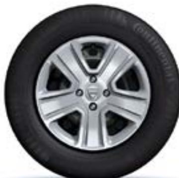
ТАСОБЕ 15" POPSTER*