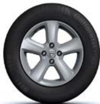
АЛУМИНИЕВИ ДЖАНТИ 15" CHAMADE*