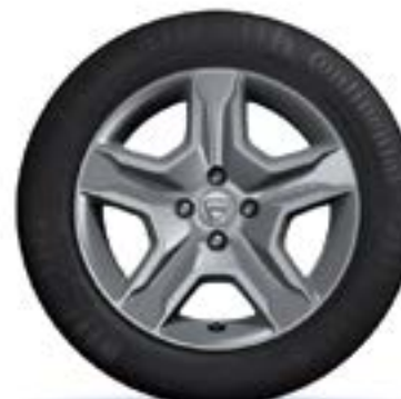
ТАСОБЕ 16" BAYADÈRE DARK METAL*