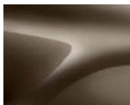
КАФЯВ „ВИЖЪН“ (CNM) (2)