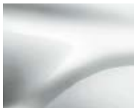
ЛЕДНИКОВО БЯЛ (369) (1)