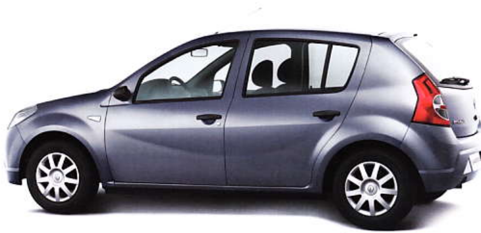
VERSÃO AUTHENTIQUE (PACK PLUS)

DEIXE-SE LEVAR POR UMA DAS VERSÕES DO RENAULT SANDERO.