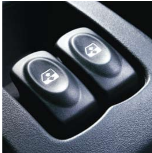
VIDROS ELÉTRICOS: MAIS CONFORTO E PRATICIDADE.

O INTERIOR DO SANDERO OFERECE DETALHES E EQUIPAMENTOS QUE PROPORCIONAM O MÁXIMO EM CONFORTO E DESIGN.