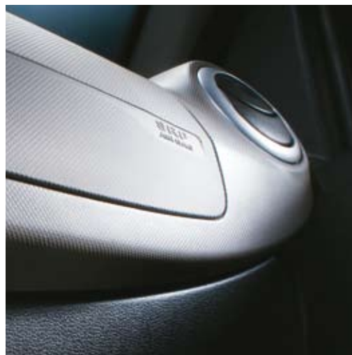
O AIR BAG DUPLO OFERECE A SEGURANÇA QUE VOCÊ MERECE.