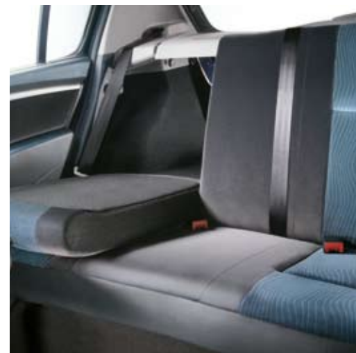
BANCO TRASEIRO BIPARTIDO.