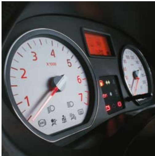
COMPUTADOR DE BORDO NO PAINEL DE INSTRUMENTOS.