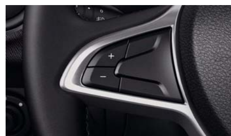
Круиз-контроль (ограничитель скорости)