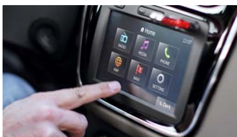
Мультимедийная система Media Nav с сенсорным экраном, навигацией и Bluetooth