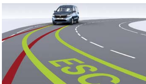
Система курсовой устойчивости ESP