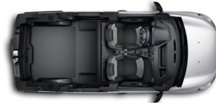
Rücksitzbank gewickelt – für eine ebene Ladefläche

Im Dacia Dokker ist Platz genug für die ganze Familie. Und der Kofferraum mit 800 Litern Volumen 1 (min. unter Gepäckraumabdeckung) reicht auch für das große Gepäck. Dank seiner niedrigen Ladekante und der asymmetrisch geteilten Hecktüren lässt er sich spielend leicht be- und entladen. Größere Transportaufgaben löst der Dacia Dokker mit seiner multifunktionalen Rücksitzbank: Sie ist zu \frac{1}{3} , \frac{2}{3} oder komplett umklappbar. 2 So haben Sie immer die Wahl zwischen bis zu fünf komfortablen Sitzplätzen oder einer großen Ladefläche, ganz nach Bedarf. Ob beim Einsteigen zur Fahrt in den Familienurlaub oder beim Beladen nach dem Großeinkauf – die seitlichen Schiebetüren 2 mit einer Breite von 70,3 cm machen beides gleich bequem.