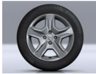
16-ZOLL-DESIGNRÄDER IN TITAN-OPTIK 1