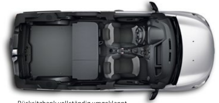
Rücksitzbank vollständig umgeklappt