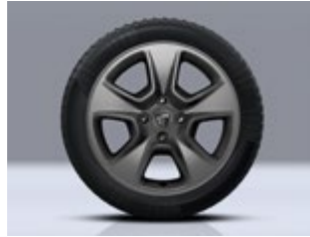
15-ZOLL-LEICHTMETALLRÄDER, 5 SPEICHEN (NUR FÜR DOKKER KLASSE N1) 1