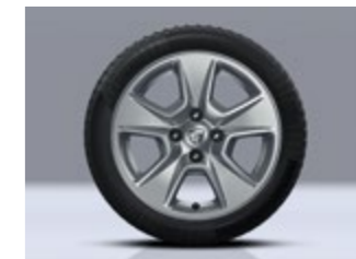
OPTIONALE 15-ZOLL-LEICHTMETALLRÄDER (NUR FÜR DOKKER KLASSE N1) 1