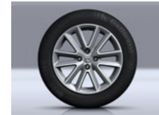
OPTIONALE 16-ZOLL-LEICHTMETALLRÄDER 1