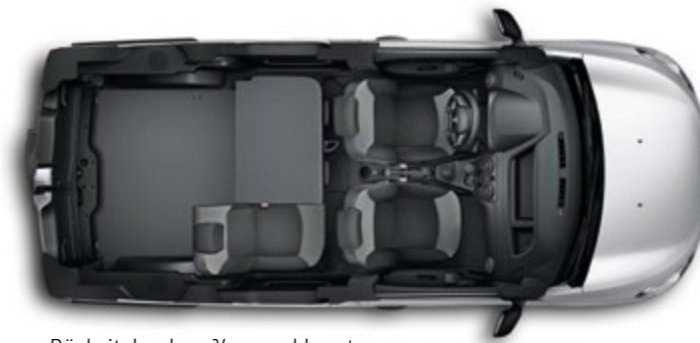
Rücksitzbank zu \frac{2}{3} umgeklappt