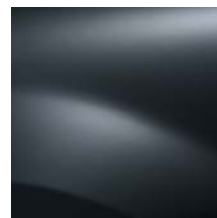
GRIS COMÈTE KNA (TE)