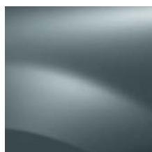
BLEU ELECTRIQUE RNZ (TE)