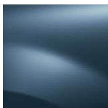
BLEU MINÉRAL RNF (TE)