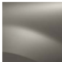
GRIS BASALTE KNM (TE)