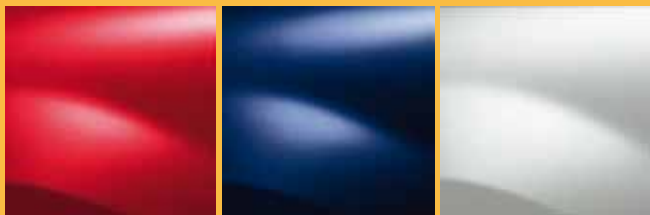
ΚΟΚΚΙΝΟ PASSION 210 (ΟΥ)