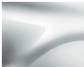
BLANC GLACIER (369) (1)