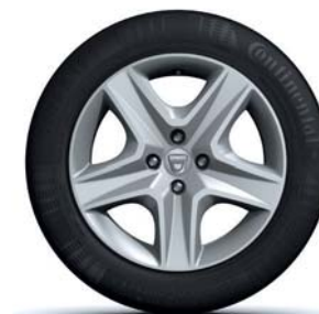
JANTES DESIGN 16" OASIS*