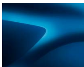
BLEU AZURITE (RPL) ***(2)