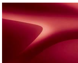
ROUGE DE FEU (B76) (2)