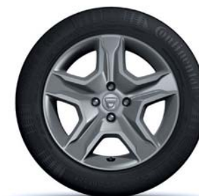
JANTES DESIGN 16" BAYADÈRE DARK METAL**