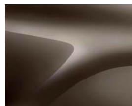
BRUN VISON (CNM) (2)