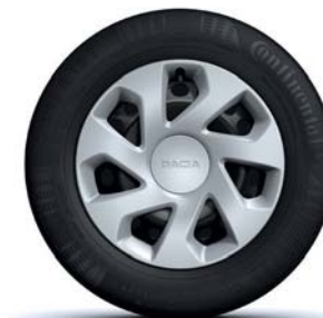
ENJOLIVEUR 15" GROMMY*