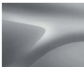
GRIS PLATINE (D69) (2)