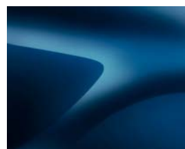
BLEU COSMOS (RPR) (2)