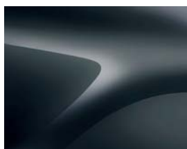
GRIS COMÈTE (KNA) (2)