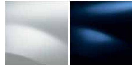
JÉGFEHÉR (389) TENGERSZÉKÉ D42