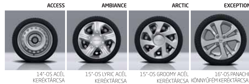
14"-OS ACÉL KERÉKTÁRCSA 15"-OS LYRIC ACÉL KERÉKTÁRCSA 15"-OS GROOMY ACÉL KERÉKTÁRCSA 16"-OS PANACHE KÖNNYŰFÉM KERÉKTÁRCSA*