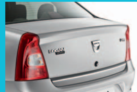
Átalakított hátsó rész: új csomagtartófedél, lökhárító és lámpatestek.