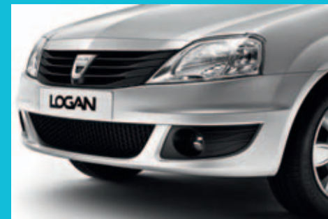
Új, modernebb megjelenésű orrrész (új logo, lökhárító és első fényszórók)

Örömteli vezetés, kényelmes utastér, kitűnő klíma... Akár a mindennapokra, akár hosszabb utakra – minden feltétel adott a kellemes utazáshoz. A vezetési pozíció ideális a kézre eső kezelőszerveknek, a gerinctámasszal* ellátott vezetőülésnek és a magasságban állítható biztonsági öveknek* köszönhetően. A klímaberendezés* és az MP3 kompatibilis* rádió-CD kapcsolói harmonikusan illeszkednek a középkonzolba. A tér optimális kihasználása érdekében számos rakodóhely áll rendelkezésre. Üdvözljük a fedélzetén!