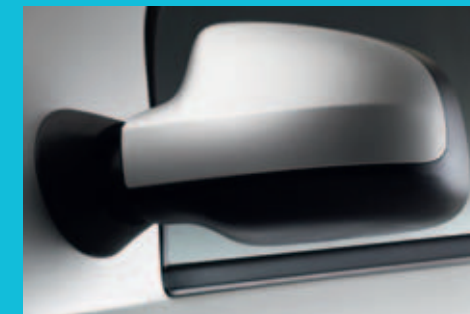
Felszereltségi szinttől függően a gépkocsi színére fűjt tükörház és kilincsek biztosítják az elegáns megjelenést.