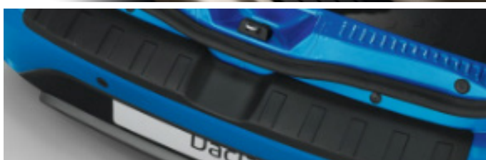
Első küszöbvédő, csomagtér küszöbvédő