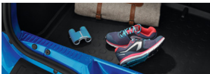
Levehető vonóhorog, csomagtér tálca