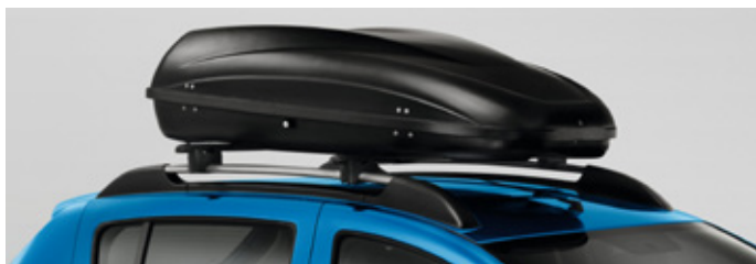
Acél tetőrúd, merevfalú tetőbox