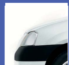
369 BIANCO GHIACCIO