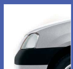
D69 GRIGIO PLATINO