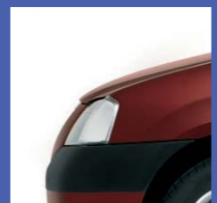
B76 ROSSO FUOCO