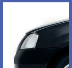
676 NERO NACRÈ