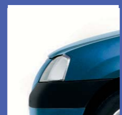
RNF BLU MINERALE