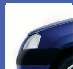
D42 BLU NAVY