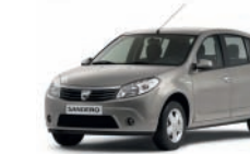
Grigio Basalto KNM*