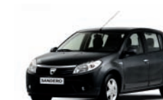
Nero Nacré 676*