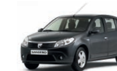
Grigio cometa KNA*