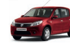
Rosso fuoco B76*