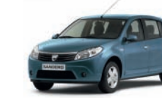
Blu Minerale RNF*