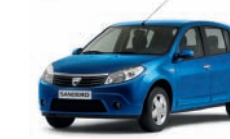
Blu Extrême RNA*