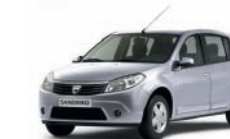
Grigio Platino D69*