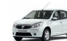
Bianco ghiaccio 369