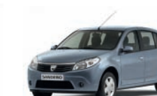
Blu Elettrico RNZ*