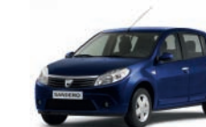
Blu Marina 61H