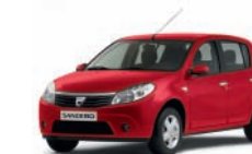
Rosso Papavero 210