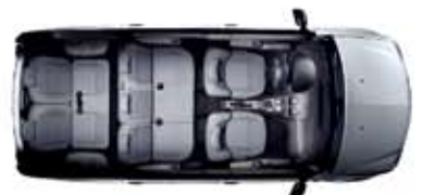
Configuration 7 places