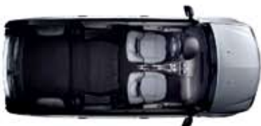
Configuration 2 places

Capable d'accueillir jusqu'à 7 passagers, la Nouvelle Dacia Logan MCV offre une habitabilité exceptionnelle et encore plus de design. La face avant du véhicule a été modernisée ainsi que la planche de bord et les harmonies intérieures. Avec elle, les escapades en famille et les trajets professionnels prennent une nouvelle dimension. Associant confort, fonctionnalité et grande capacité de chargement, Nouvelle Dacia Logan MCV est disponible en version 7 places. Elle vous accompagnera dans tous vos projets. Alors en route ?