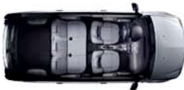
Configuration 5 places