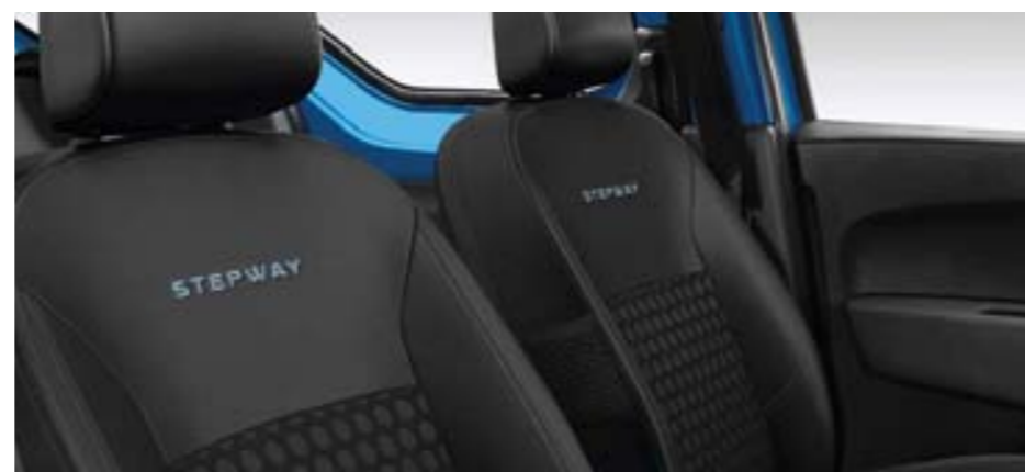
Sellerie spécifique Stepway