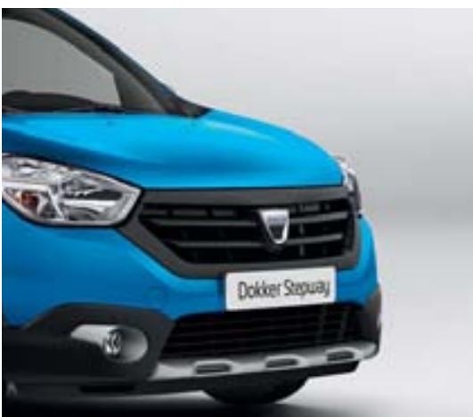
Nouvelle calandre avant