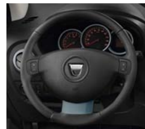
Régulateur et limiteur de vitesse