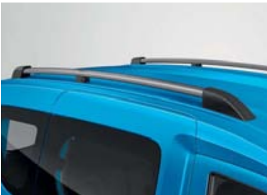
Barres de toit Dark Metal