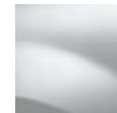
BLANC GLACIER (389)