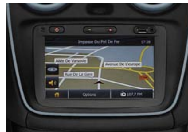
Système multimédia MEDIA NAV