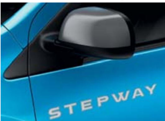
Coque de rétroviseur Dark Metal et striping Stepway