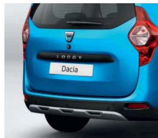
pare-choc avec ski de protection