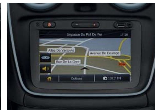
Système multimédia et de navigation MEDIA NAV*