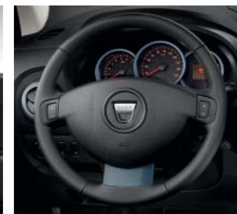
Régulateur et limiteur de vitesse