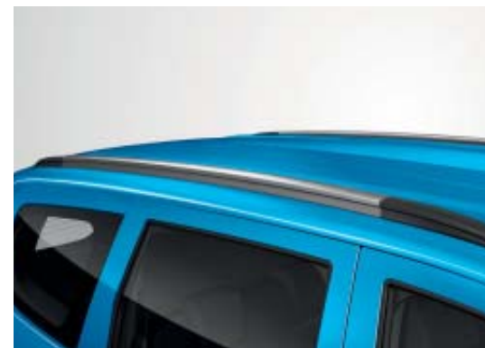
Barres de toit Dark Metal