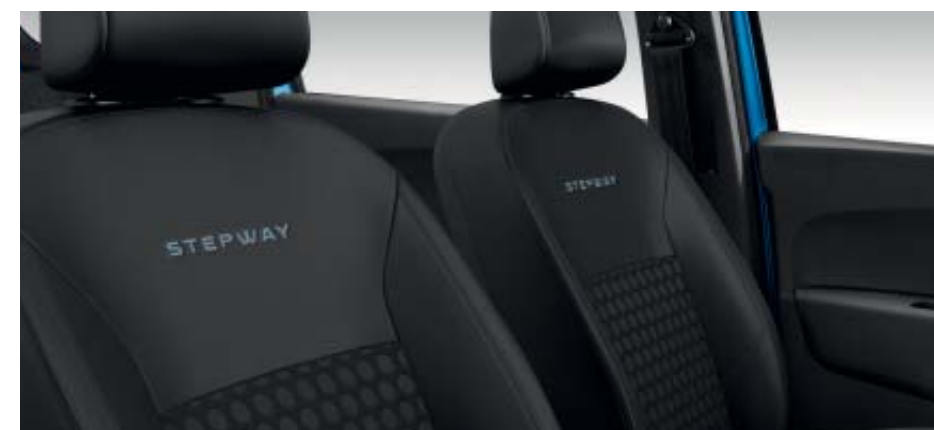
Sellerie spécifique Stepway