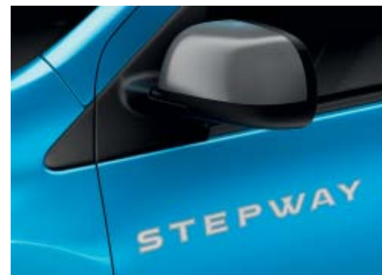
Coque de rétroviseur Dark Metal et striping Stepway