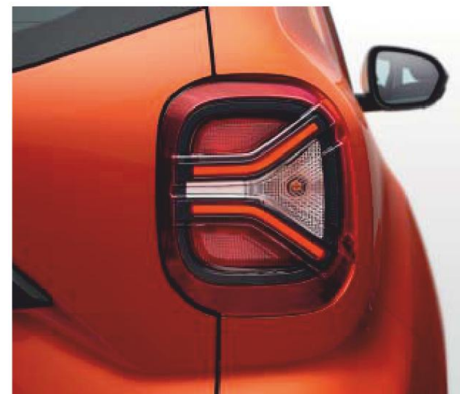
ICONISCHE Y-VORMEN IN DE VERLICHTING