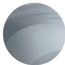
GRIS HIGHLAND (2)