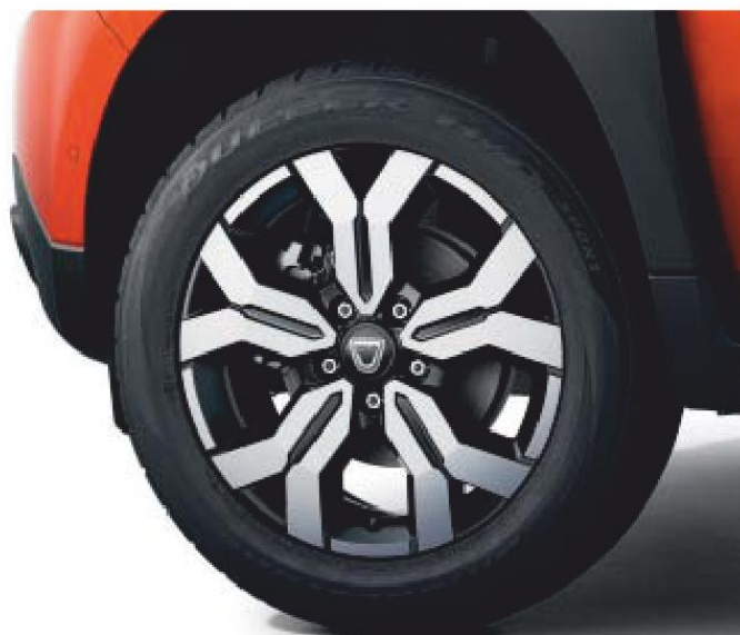
17" LICHTMETALEN WIELEN

De nieuw ontworpen spoiler helpt de CO 2 -uitstoot te verminderen en verbetert ook nog eens de rijbewegingen van de auto. De nieuwe lichtmetalen wielen voegen dat vleugje avontuur toe dat zo sterk bij Duster hoort. En dan de nieuwe kleur Orange Arizona, een echte uitnodiging om op pad te gaan! * Groot licht uitgezonderd.