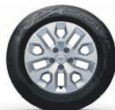
16" LICHTMETALEN WIEL 'ORAGA'