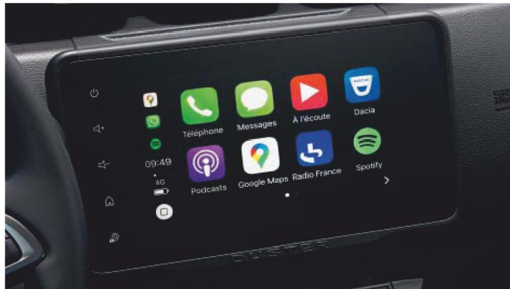
SMARTPHONE REPLICATIE VIA APPLE CARPLAY™* OF ANDROID AUTO™* OP EEN 8" TOUCHSCREEN