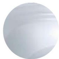
BLANC GLACIER (1)