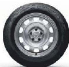
16" STALEN WIEL