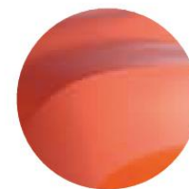
ORANGE ARIZONA (2)

(1) Lak met vernislaag - (2) Metallic lak