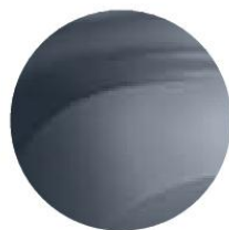
GRIS COMÈTE (2)