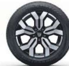
17" LICHTMETALEN WIEL 'TERGAN'