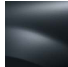
GRIS COMÈTE KNA