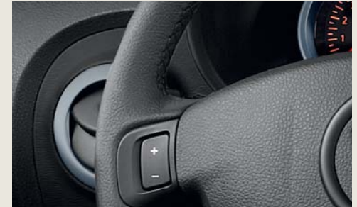
Cruise Control met snelheidsbegrenzer