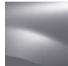
GRIS PLATINE D69