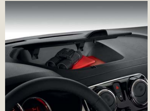
Opbergvak bovenzijde dashboard