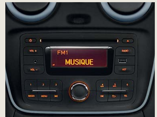
Plug & radio