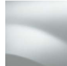
BLANC GLACIER 369