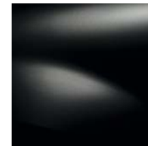
NOIR NACRÉ 676