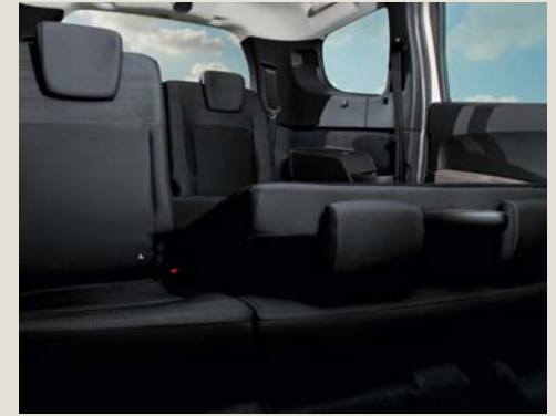
Tweede zitrij in delen neerklapbaar (1/3 en 2/3)