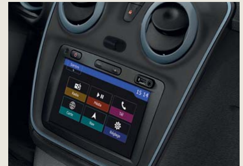
USB en jack- aansluiting