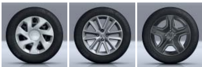
STALEN WIELEN 15" GROOMY