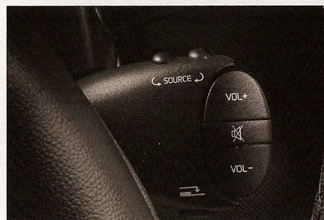
Radio CD/MP3 met jackplug aansluiting en bediening achter het stuurwiel optioneel in pack exclusive