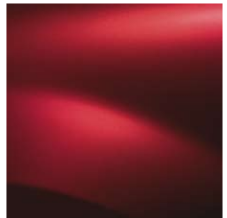
ROUGE DE FEU