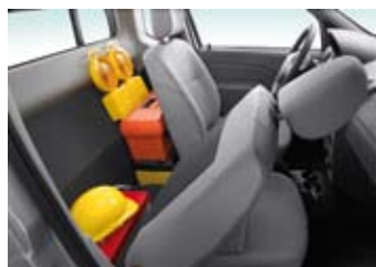
NEERKLAPBARE RUGLEUNING IN DE LOGAN PICK-UP