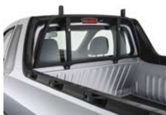
STANDAARD PALENJUK IN DE LAADBAK