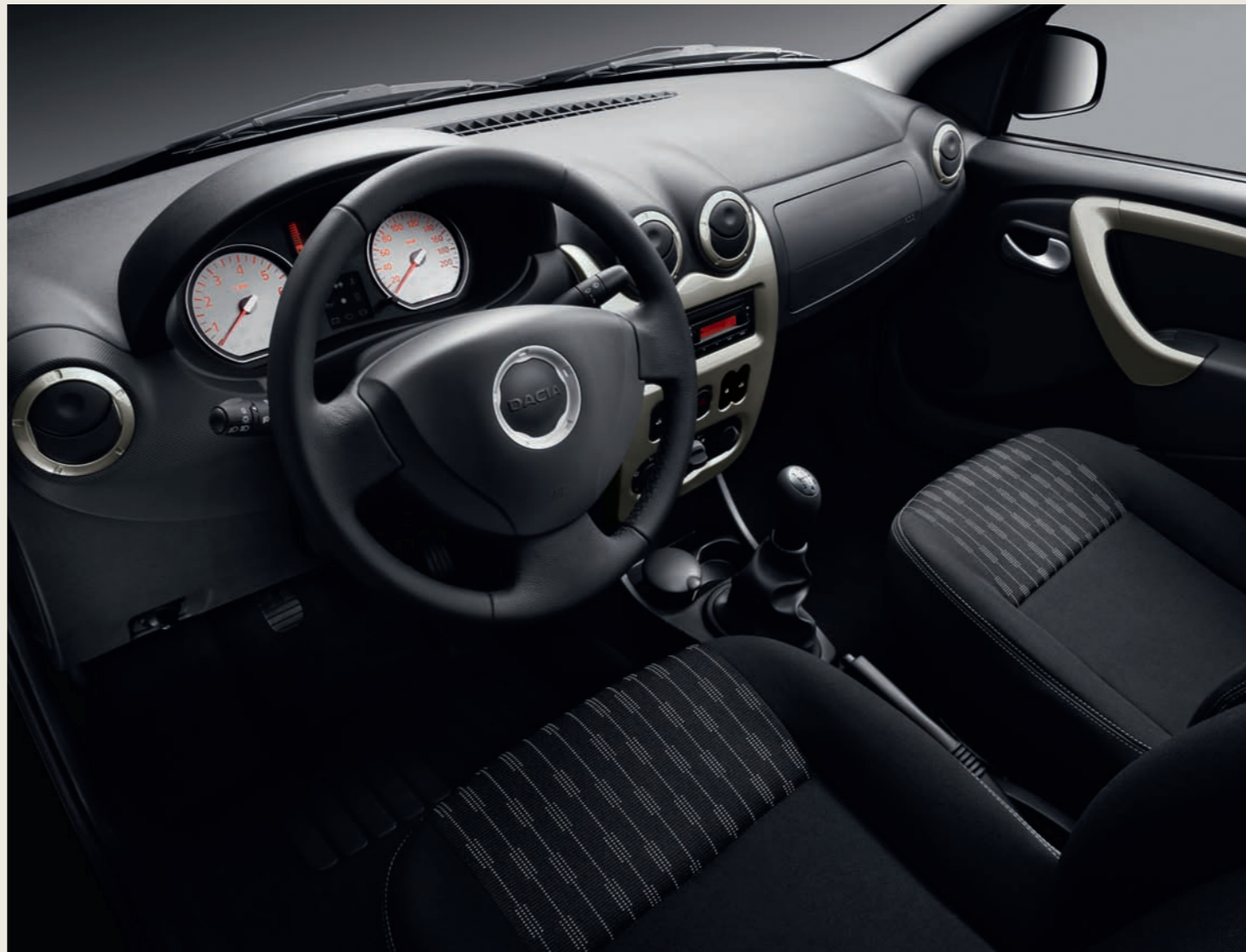
Interieur Logan MCV