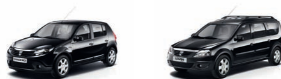
Zwarte koplampmaskers voor de Sandero.