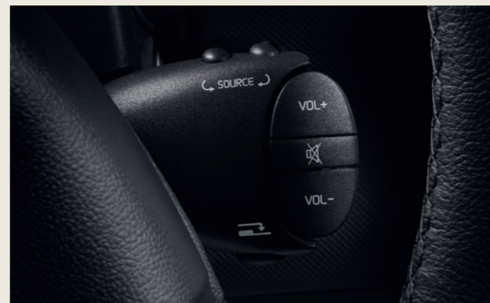
Radio CD/MP3 met jackplug aansluiting en bediening achter het stuurwiel optioneel in het Pack Exclusive.

Waarom zou u tussen elegantie en prijs kiezen? De Serie Limitée Black Line Sandero en Logan MCV biedt u beide. Het comfort, de veiligheid en de voortreffelijke prijs /kwaliteit verhouding zijn altijd opgenomen in de genen van het Dacia gamma. Maar wat betreft stijl en uitrusting brengt de Serie Limitée Black Line u nog meer! Het exterieur design heeft een onderscheidend vermogen door: de metaallak die leverbaar is in de kleuren Noir Nacré, Gris Platine of Gris Comète*, de zwarte koplampmaskers voor een extra sportiviteit op de Sandero, de portierhandgrepen + de achteruitkijkspiegels + stootstrips op de deuren allen uitgevoerd in kleur van de carrosserie, en de sierstrip aan de bovenkant van de grille uitgevoerd in chroomkleur. Het interieur is voorzien van een speciale bekleding en een dashboard afgewerkt met Chroomkleurige details. Met deze exclusieve Black Line serie profiteert u bovendien van een audiosysteem voorzien van radio-CD/MP3 met bediening achter het stuurwiel en een jack plug aansluiting waarop u uw MP3-speler kunt aansluiten. En voor een maximaal comfort zijn er talrijke opties beschikbaar zoals de airconditioning, het met leder beklede stuurwiel en de lichtmetalen wielen. De Serie Limitée Black Line, het plezier ontmoet de sierlijkheid.