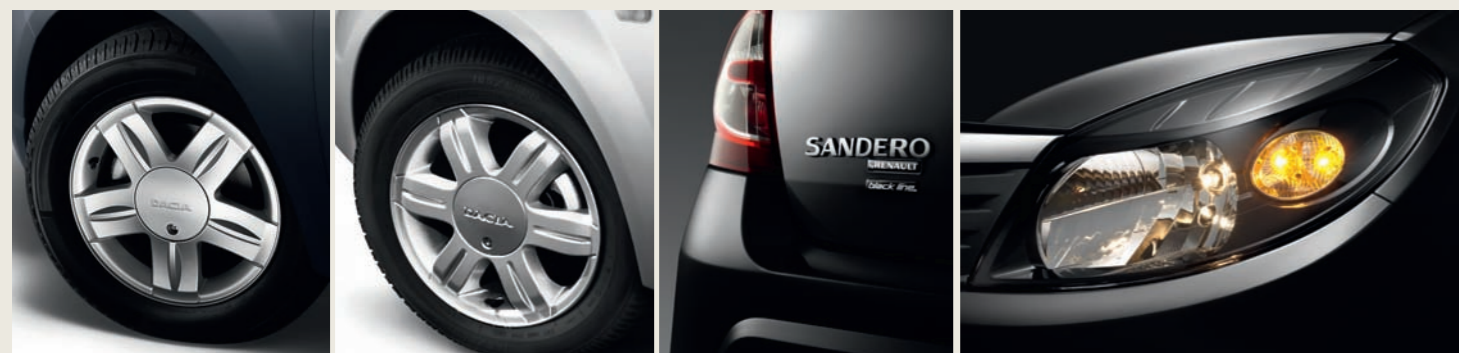
Lichtmetalen wielen 15" Sandero