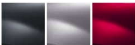
GRIS COMÈTE KNA (MV) GRIS PLATINE D59 (MV) ROUGE DE FEU B76 (MV)