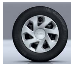
WIELDOP 15" GROOMY