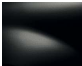
NOIR NACRÉ (676)