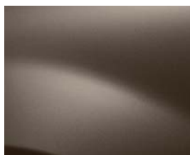
BRUN VISON (CNM)