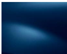
BLEU COSMOS (RPR)