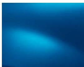
BLEU AZURITE (RPR)**