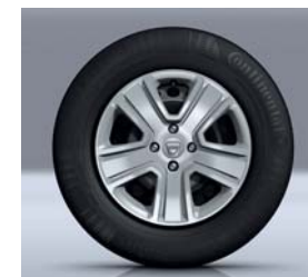
WIELDOP 15" POPSTER