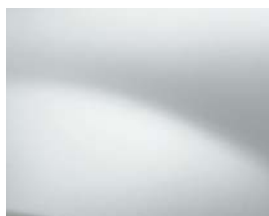
BLANC GLACIER (369)