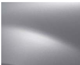
GRIS PLATINE (D69)