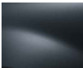
GRIS COMÈTE (KNA)