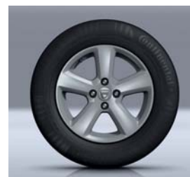
LICHTMETAAL WIEL 15" CHAMADE*