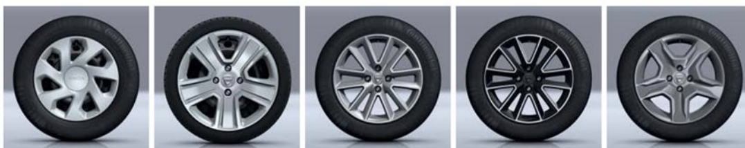
EMBELEZADOR DE RODA 15"