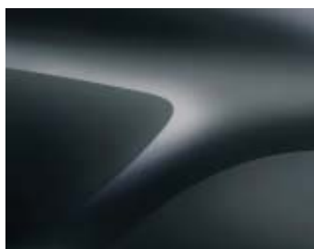
CINZENTO COMETA (KNA) (2)