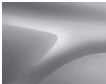
CINZENTO HIGHLAND (KQA) (2)