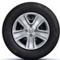
EMBELEZADORES DE RODA 15"