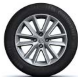
JANTES EM LIGA LEVE 16"