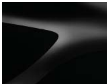
PRETO NACARADO (676) (2)