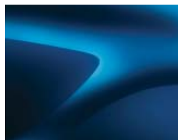
AZUL AZURITE (RPL) (2)*