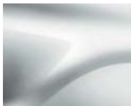
BRANCO GLACIAR (369)