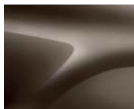
CASTANHO VISON (CNM)