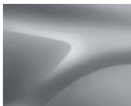
CINZENTO HIGHLAND (KQA)