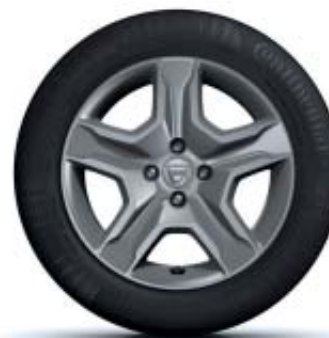
JANTES FLEXWHEEL 16"