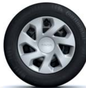
EMBELEZADORES DE RODA 15"