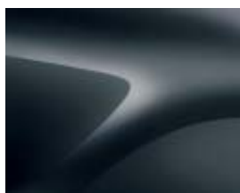
CINZENTO COMETA (KNA)