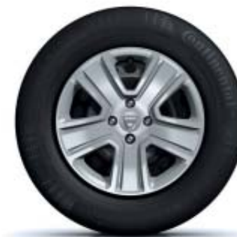
EMBELEZADORES DE RODA 15"