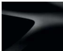
PRETO NACARADO (676)