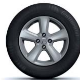
JANTES EM LIGA LEVE DE 15"