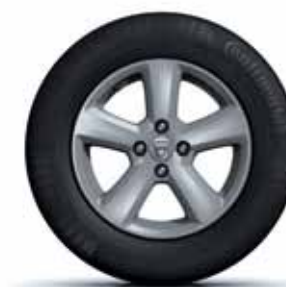
JANTES EM LIGA LEVE DE 15"