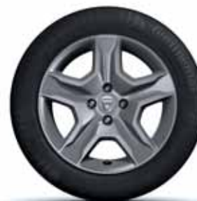
JANTES FLEXWHEEL 16"