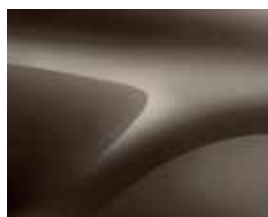
CASTANHO VISON (CNM)