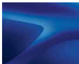
AZUL IRON (RQH)