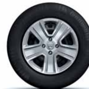
EMBELEZADORES DE RODA 15"