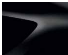
PRETO NACARADO (676)