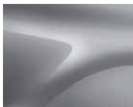
CINZENTO HIGHLAND (KOA)