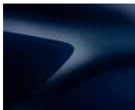
AZUL NAVY (D42)