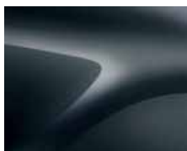
CINZENTO COMETA (KNA)