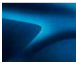
AZUL AZURITE (RPL)