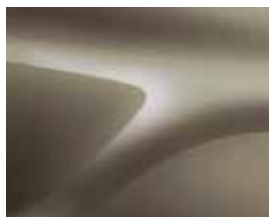
BEGE DUNE (HNP)

Algumas cores poderão estar disponíveis apenas em determinadas versões.