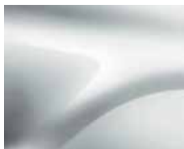
BRANCO GLACIAR (369)