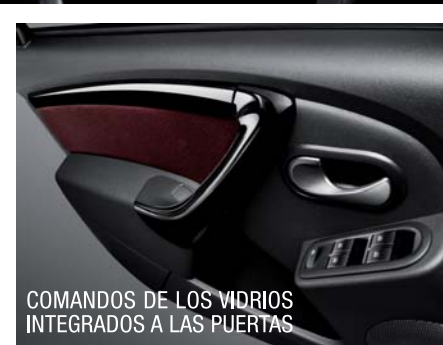
COMANDOS DE LOS VIDRIOS INTEGRADOS A LAS PUERTAS