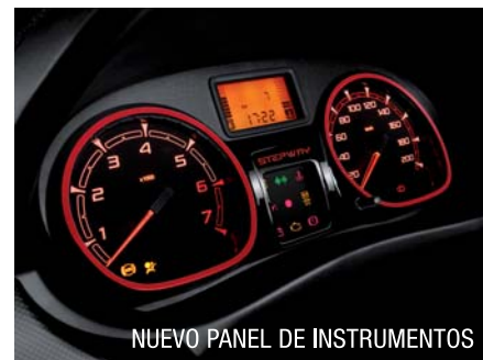
NUEVO PANEL DE INSTRUMENTOS

El Stepway se renovó por dentro y por fuera. Un nuevo frente y detalles renovados en sus ópticas traseras ponen un fuerte acento deportivo en este crossover de Renault. Grandes y estilizadas ópticas frontales, con el apoyo de busca huellas para una iluminación óptima en cualquier camino. Un nuevo y muy juvenil interior con extremo cuidado en los detalles para dar una sensación de increíble adrenalina con el solo hecho de ingresar a su habitáculo. Una capacidad de baúl muy difícil de creer, y si las necesidades de espacio son mayores, solamente con plegar los asientos se puede cargar mucho más.