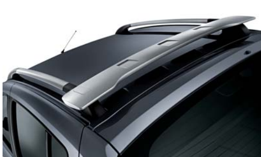
RACK DE TECHO CON ALERÓN INTEGRADO