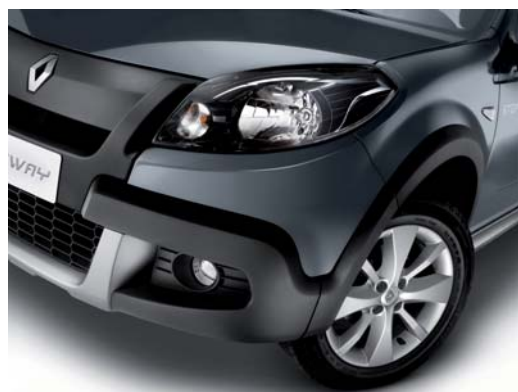
NUEVO FRENTE CON DISEÑO MÁS MODERNO.