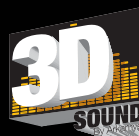
NUEVO SISTEMA DE SONIDO