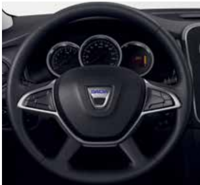
Volan cu patru brațe

*disponibil opțional în funcție de versiune