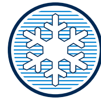
AER CONDIȚIONAT AUTOMAT