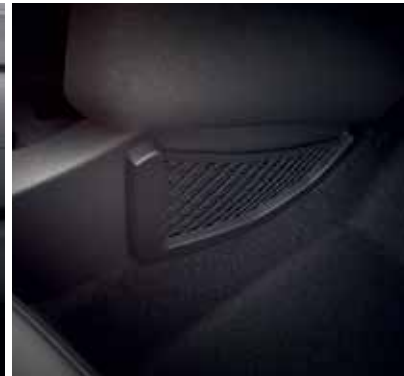
Buzunar de depozitare