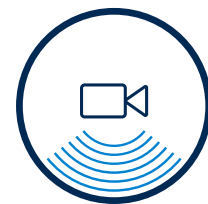
ASISTENȚĂ VIDEO LA PARCARE