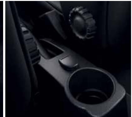
Priză de 12V