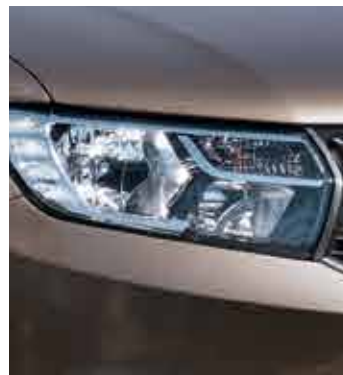
Lumini de zi LED

Disponibil în patru niveluri diferite de echipare – Acces, Ambiance, Laureate și vârful de gamă Prestige – și cu o gamă variată de accesorii, Logan se poate configura ușor în funcție de așteptările tale.