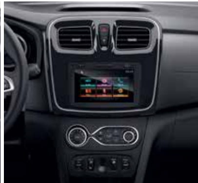
Planșă de bord