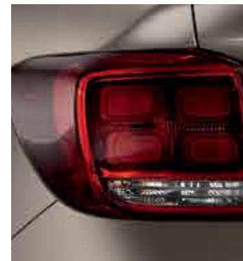
Blocuri optice redesenat