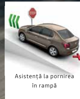
Asistență la pornirea în rampă