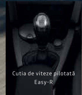
Cutia de viteze pilotată Easy-R

*disponibilă opțional în funcție de versiune