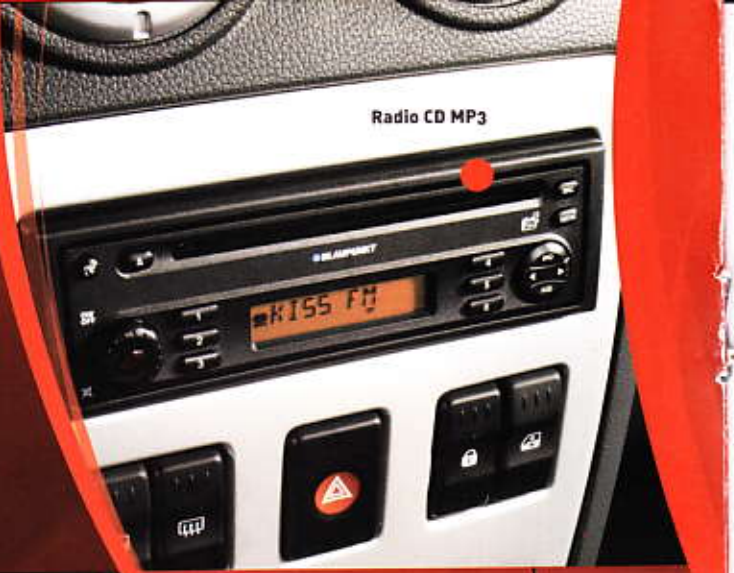
Radio CD MP3