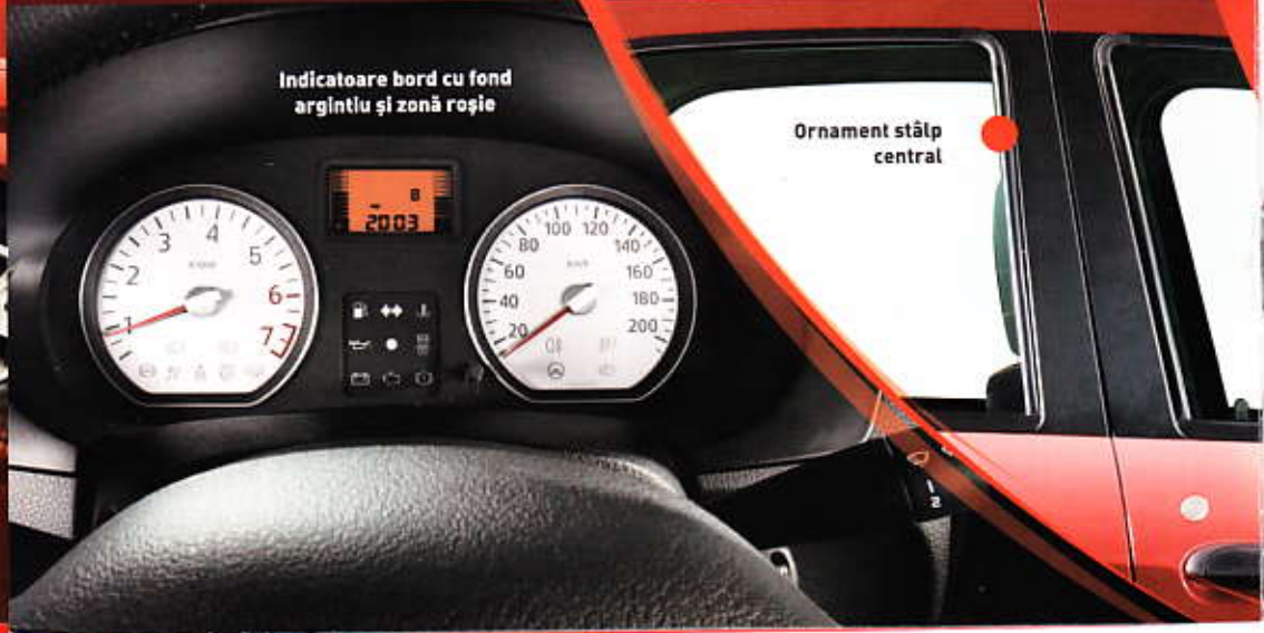
Indicatoare bord cu fond argintiu și zonă roșie