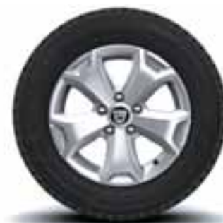
NAPLATCI 16" CYCLADE