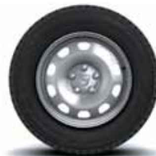
NAPLATCI 16" TÔLE