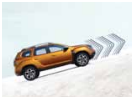
POMOĆ PRI KRETANJU NA UZBRDICI

Bilo na asfaltu ili na neuređenom terenu, Novi Dacia Duster uvek ima odgovarajuće rešenje: pomoć pri kretanju na uzbrdici savladava uzvišenja brzo i jednostavno, a sistem za kontrolu brzine na nizbrdici obezbeđuje umerenu brzinu spuštanja. A s obzirom na to da je ponekad teško imati pogled na sve, kamera za prikaz iz više uglova otkriće sve neravnine, kamenje ili male prepreke kako bi vam olakšala vožnju.