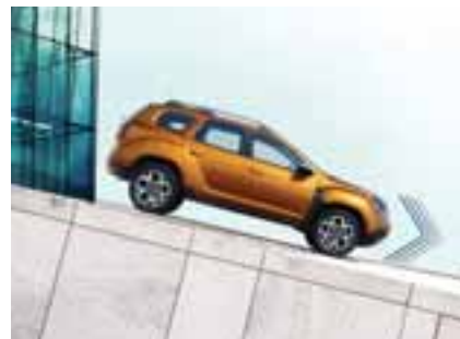
POMOĆ PRI KRETANJU NIZBRDO