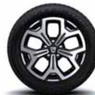
NAPLATCI 17" MALDIVES