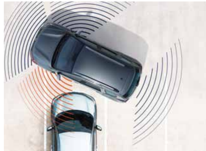
KAMERA ZA PRIKAZ IZ VIŠE UGLOVA