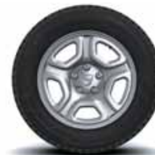
NAPLATCI 16" FIDJI