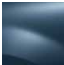
PLAVA RNF (TE)