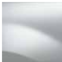
LEDENO BELA 369 (OV)