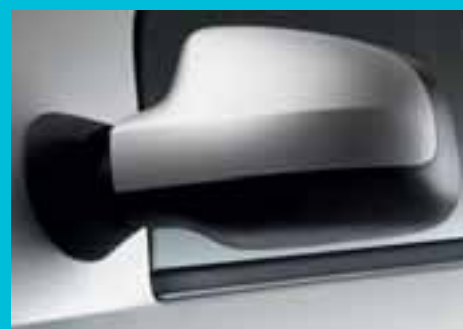
Novi dizajn spoljašnjih retrovizora osigurava još bolju vidljivost pozadi, što pridonosi sveukupnoj udobnosti i sigurnosti.