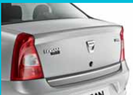
U redizajnirani zadnji deo Dacie Logan savršeno se uklapaju novi farovi i branik.