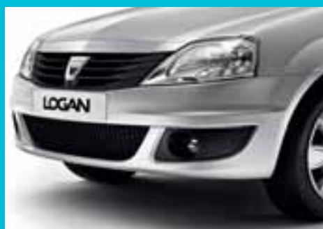
Nova maska, novi branik i novi farovi: prednji deo Dacie Logan odlikuje se robusnošću i modernim izgledom.

Još više prostora, bolji dizajn, lakši pristup, veća udobnost i izvrstan odnos cene i kvaliteta: to je nova Dacia Logan. Velikodušna po prirodi, nudi izuzetnu prostornost sa pet pravih udobnih sedišta i prostranim prtljažnikom. Zadnja sedišta, na koja se mogu udobno smestiti tri odrasle osobe, zahvaljujući većim dimenzijama kabine dobijaju i na širini i na visini, a istovremeno omogućavaju veliku slobodu pokreta, što je pretpostavka udobnosti. Da biste mogli da ponesete prtljag za celu porodicu, prtljažnik Dacia Logan-a nudi najbolju zapreminu u svojoj kategoriji - 510 l! Robusni izgled Dacia Logan-a upućuje na izdržljivost i otpornost i u najtežim uslovima na drumu i najlošijim vremenskim prilikama. Zahvaljujući svojoj izuzetnoj pouzdanosti i sigurnosti, Dacia nudi i trogodišnju garanciju. Ipak, to nije sve, Dacia vam je pripremila i druga iznenađenja.