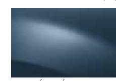
MODRÁ MINÉRAL RNF (TE)