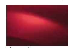
ČERVENÁ DE FEU B76 (TE)