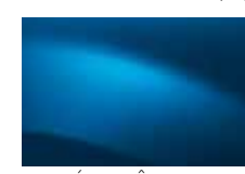
MODRÁ EXTRÊME RNA (TE)