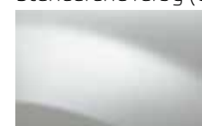
BIELA GLACIER 369 (OV)