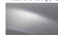
SIVÁ PLATINE D69 (TE)