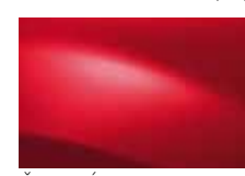
ČERVENÁ PASSION 21D (OV)