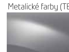
SIVÁ PLATINE D69 (TE)