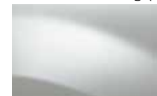
BIELA GLACIER 369 (OV)