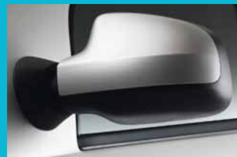
Nový dizajn vonkajších spätných zrkadiel umožňuje lepšiu výhľad dozadu a s ním spojený vyšší komfort a bezpečnosť pri riadení vozidla.