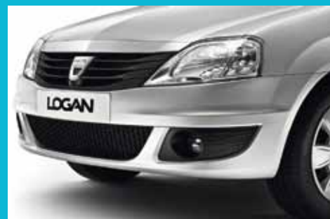
Nová predná maska, nárazník a predné svetlomety vozidla Dacia Logan vynikajú nielen robustnou konštrukciou, ale aj moderným dizajnom.

Ešte väčší priestor, prepracovanejší dizajn, pohodlie a opäť atraktívny pomer kvalita/cena: to je nová Dacia Logan. Veľkorysost' je jej prirodzenosťou: mimoriadne priestraný interiér, päť plnohodnotných miest a veľkoobjemová batožinová časť. Priestranosť na zadných sedadlách je daná výnimočnou vnútornou šírkou i výškou a môžu tu pohodlne cestovať aj tri dospelé osoby, ktoré určite ocenia nebývalý komfort sedenia a slobodu pohybu. Všetku rodinnú batožinu a ďalšie nevyhnutné veci jednoducho naložíte do batožinového priestoru s objemom 510 litrov, najväčšieho v tejto triede vozidiel. Ďalšou charakteristickou vlastnosťou vozidla Dacia Logan, navrhnutého do náročných jazdných a klimatických podmienok, je odolnosť. A vďaka vysokej úrovni spoľahlivosti a bezpečnosti Vám môže Dacia ponúknuť nadštandardnú trojročnú záruku. Dacia Logan má stále čím prekvapiť.