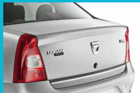
Zadná časť vozidla Dacia Logan s dokonale integrovanými svetlami a zadným nárazníkom.