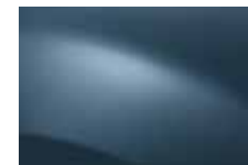
MODRÁ MINÉRAL RNF (TE)