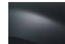
SIVÁ COMÈTE KNA (TE)