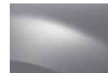
SIVÁ PLATINE D69 (TE)