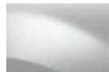
BIELA GLACIER 369 (OV)